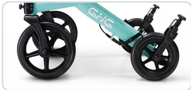
前大後小輪徑, 穩定性高不怕顛簸。