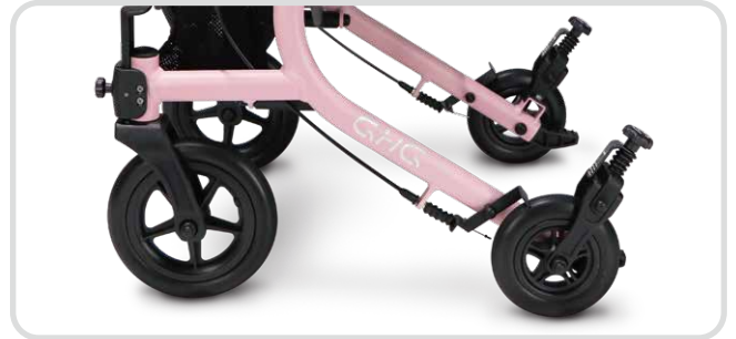
前大後小輪徑. 穩定性高不怕顛簸.